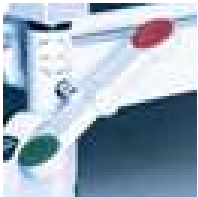
47006 - 700/701 PEDAL CAMA